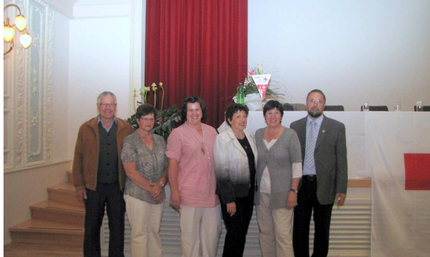
Die Geehrten und Verabschiedeten