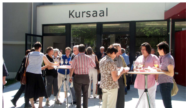
Genuss an der Sonne