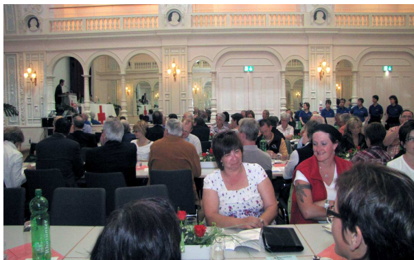
Delegierte und Gäste an der DV