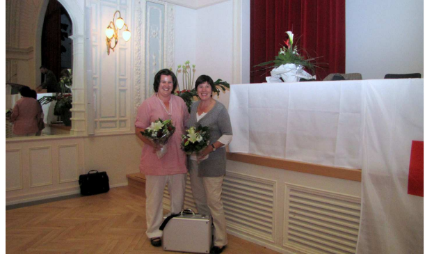
Die neuen Instruktorinnen SSB